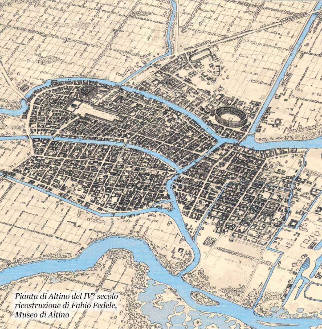
Pianta di Altino del IV° secolo ricostruzione di Fabio Fedele, Museo di Altino